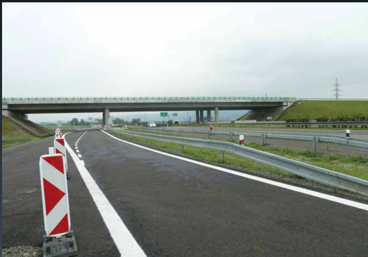
Pripájací pruh na diaľnicu D2 v smere Malacky (SO 105)