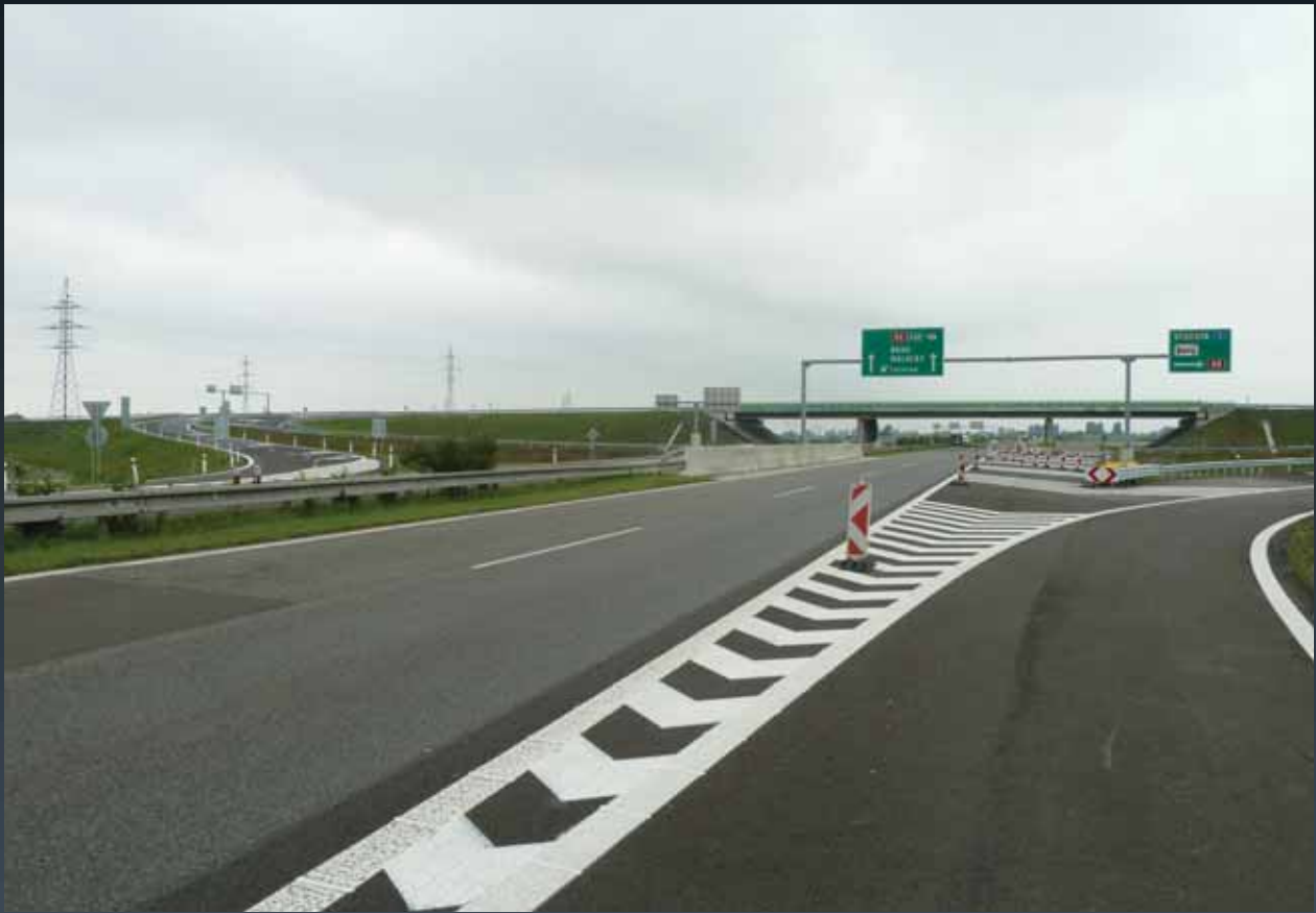
Spomalovací pruh Križovatky Stupava juh v smere D.n.Ves a Stupava (SO 103)