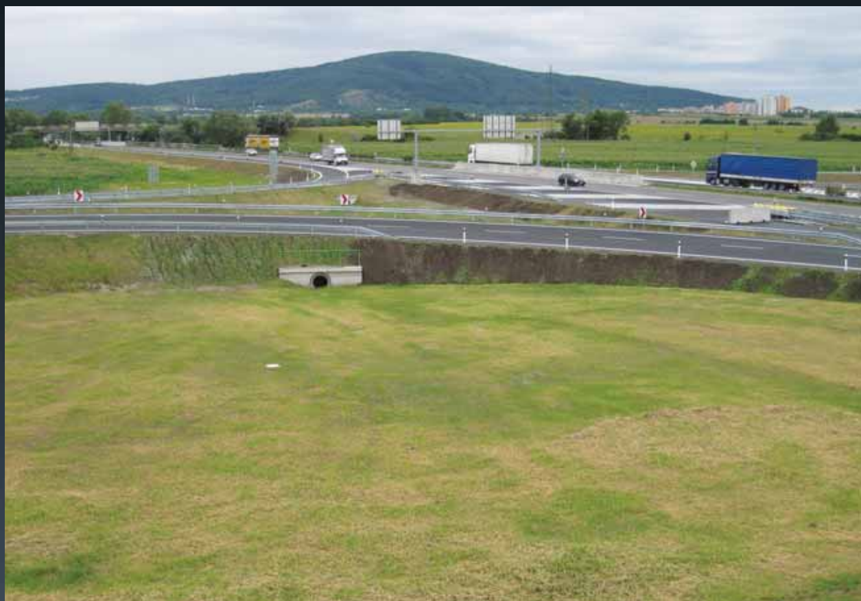
Křižovatkové vetvy diaľnic D2/D4 (SO 103)