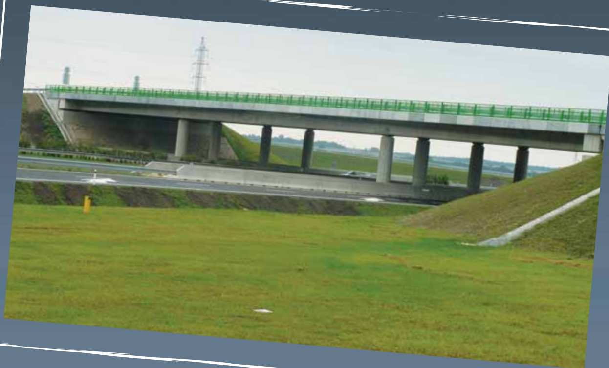
Mostné objekty ponad diaľnicu D2 (SO 211-1, SO 211-2)