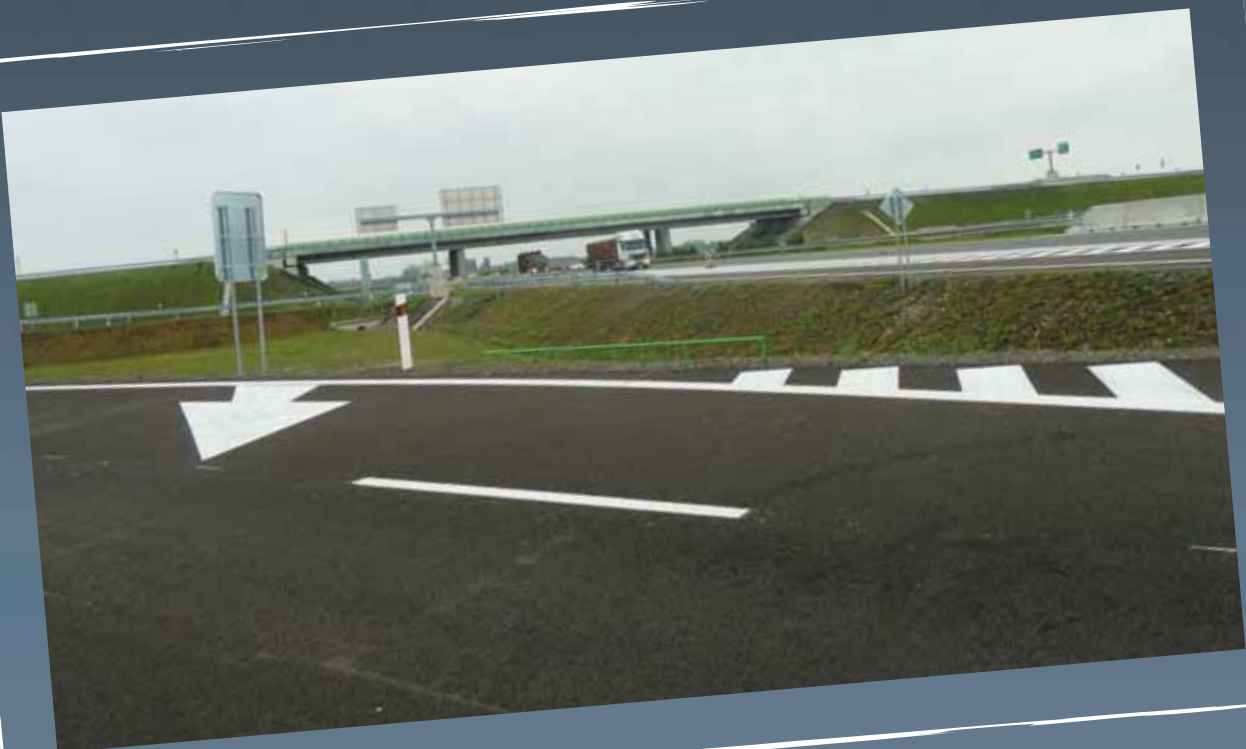
Pripájací pruh na diaľnicu D2 v smere Bratislava (SO 105)