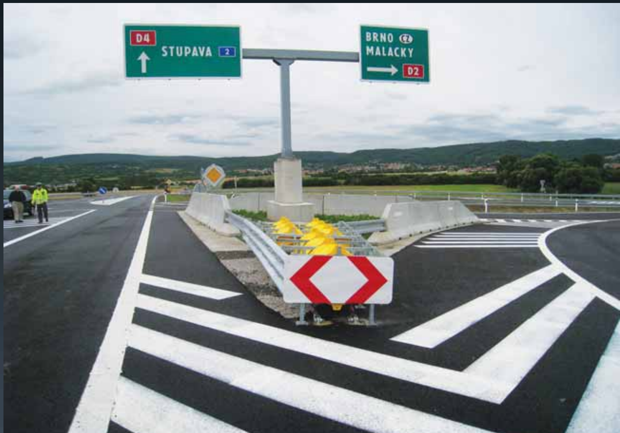
Bezpečnostné zariadenia pri portáloch TDZ (SO 101)