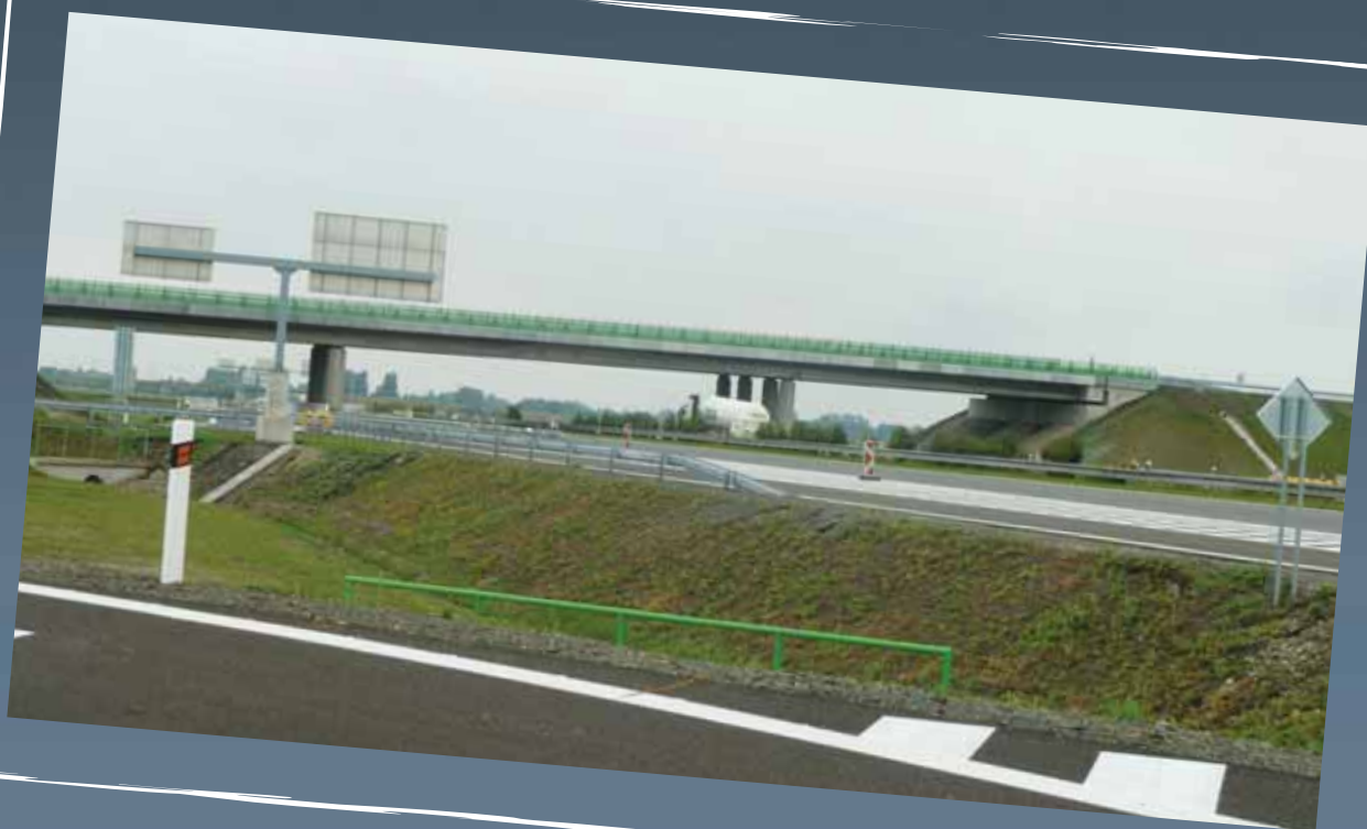
Mostné objekty ponad diaľnicu D2 (SO 211-1, SO 211-2)