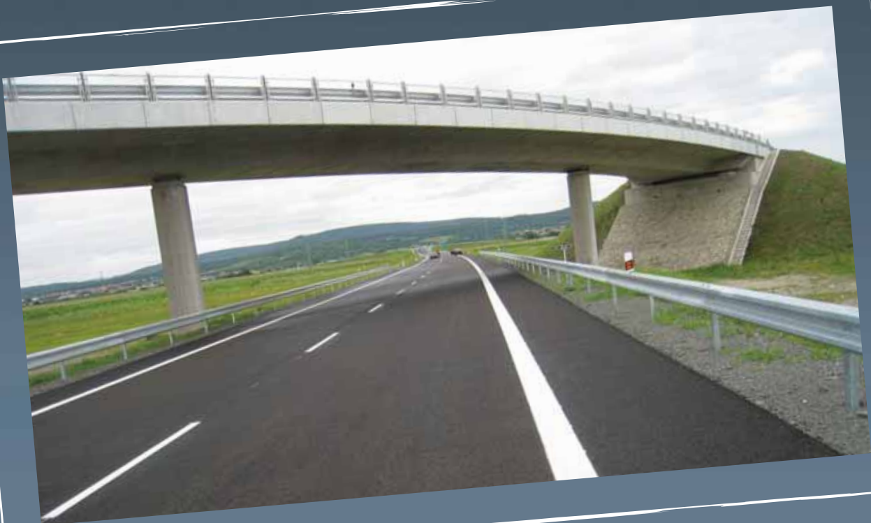
Križenie diaľnice D4 v polovičnom s miestnymi komunikáciami (SO 106, SO 212)