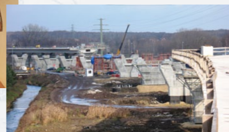
Estakáda Sošnica na úseku A1 Sošnica – Maciejów