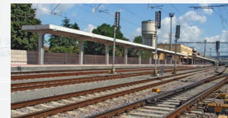
Železničná stanica Nové Mesto nad Váhom