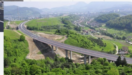
R1 Nová Baňa – Rudno nad Hronom (ocenenie v súťaži STAVBA ROKA 2004)