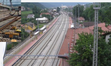
Modernizácia železničnej trate Žilina – Krásno nad Kysucou